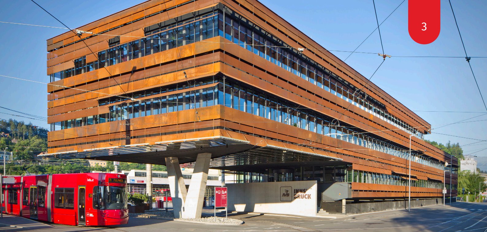
Abb: Blick auf das IVP Hauptgebäude