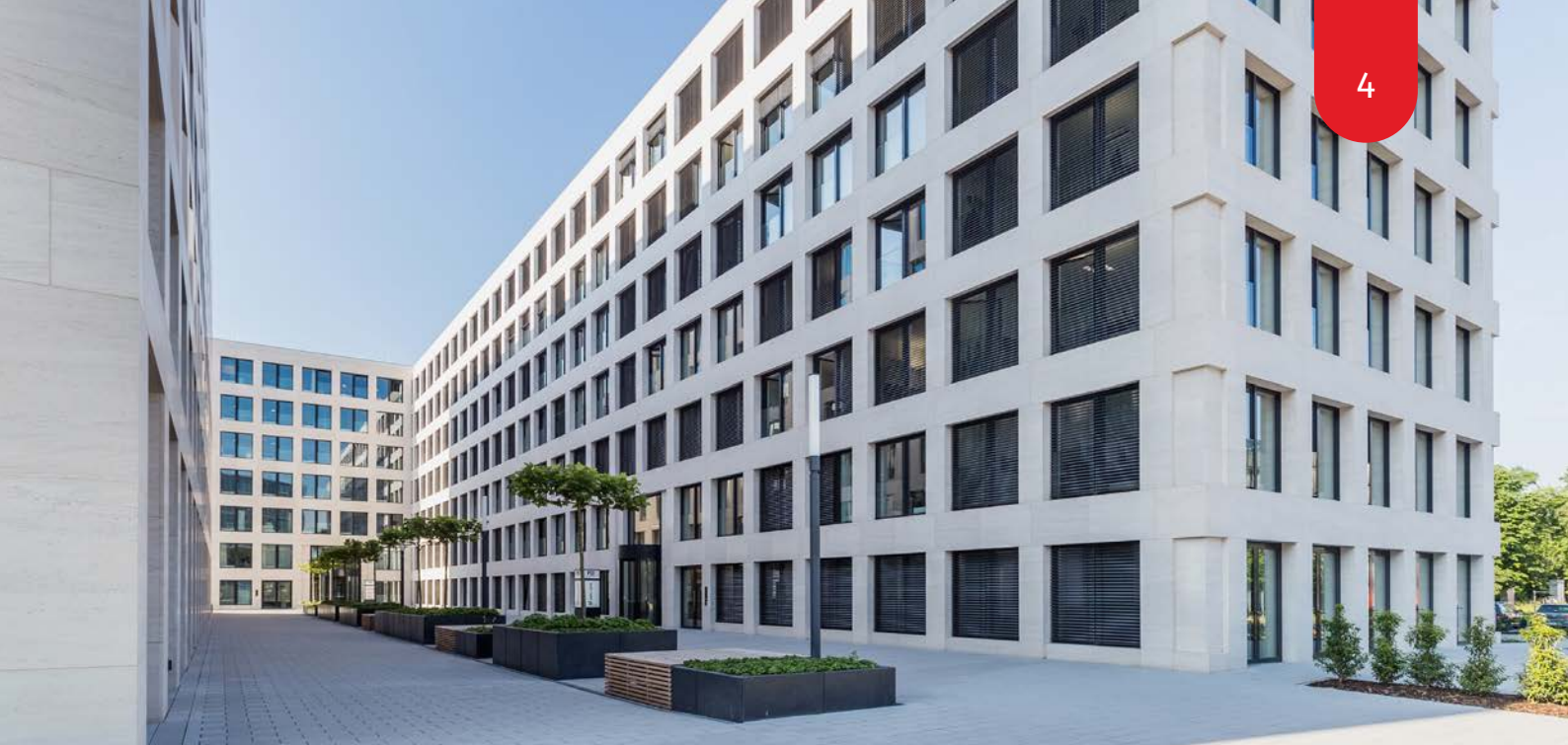
Außenansicht der Unternehmenszentrale in Darmstadt